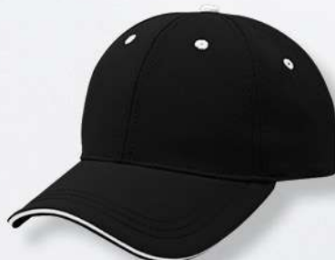
BLACK / WHITE