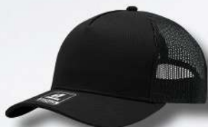
BLACK / BLACK