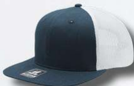
NAVY / WHITE