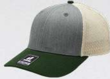
HEATHER GREY / OLIVE / STONE