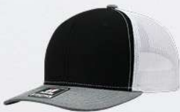
BLACK / HEATHER GREY / WHITE