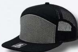
BLACK / HEATHER GREY / BLACK