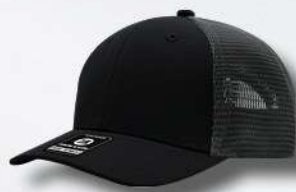
BLACK / OXFORD