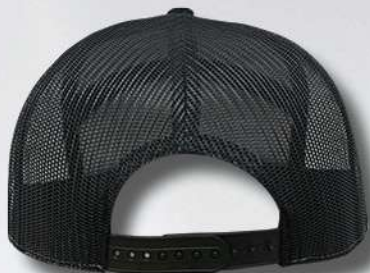
BLACK / CAMO / BLACK