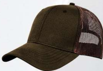
BROWN / BROWN