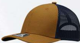
MUSTARD / NAVY