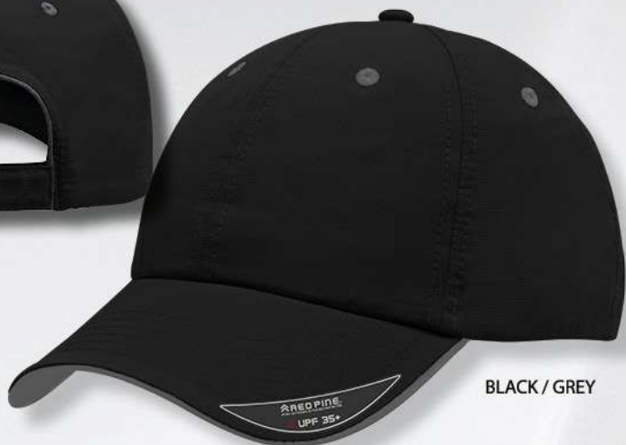
BLACK / GREY