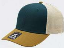
STEEL / CAMEL STONE