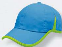
AQUA / NEON GREEN