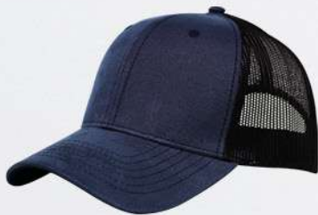
NAVY / BLACK