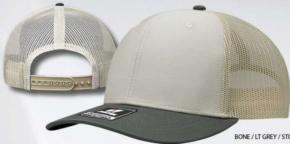
BONE / LT GREY / STONE