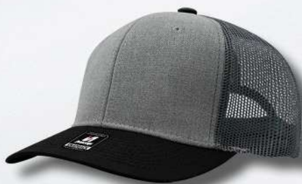
GREY / BLACK