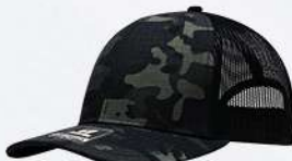
BLACK / CAMO