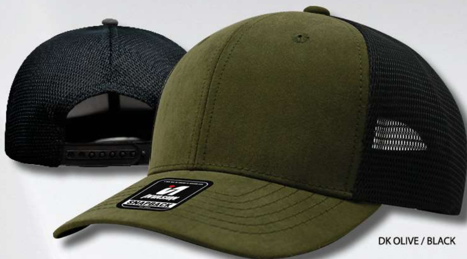
DK OLIVE / BLACK