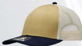
CORN / NAVY / STONE