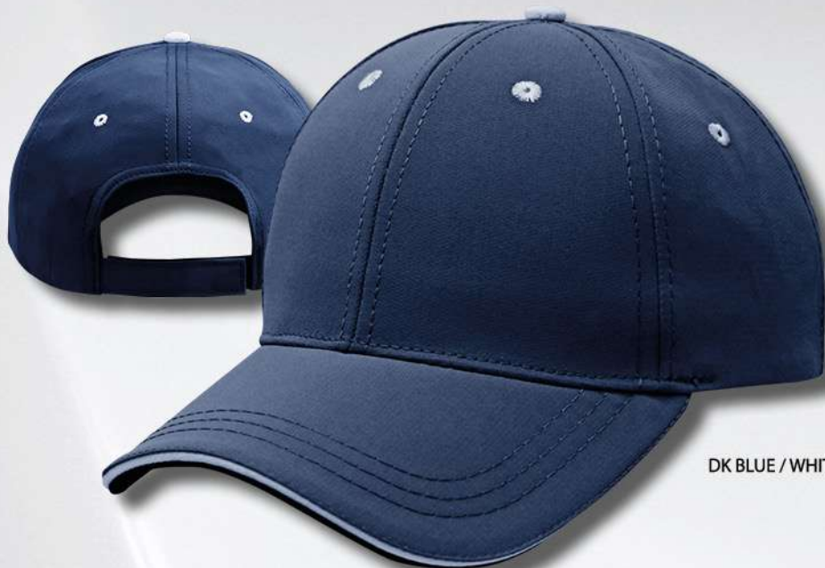
DK BLUE / WHITE