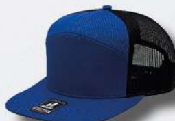
ROYAL / BLACK