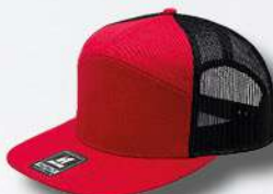
RED / BLACK