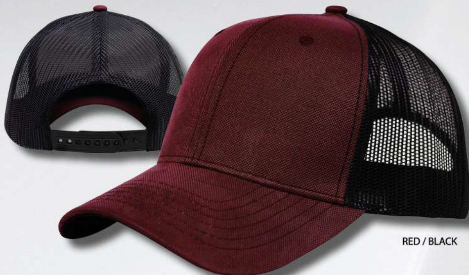
RED / BLACK