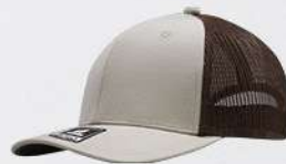
STONE / BROWN