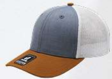
BLUE / CAMEL / WHITE