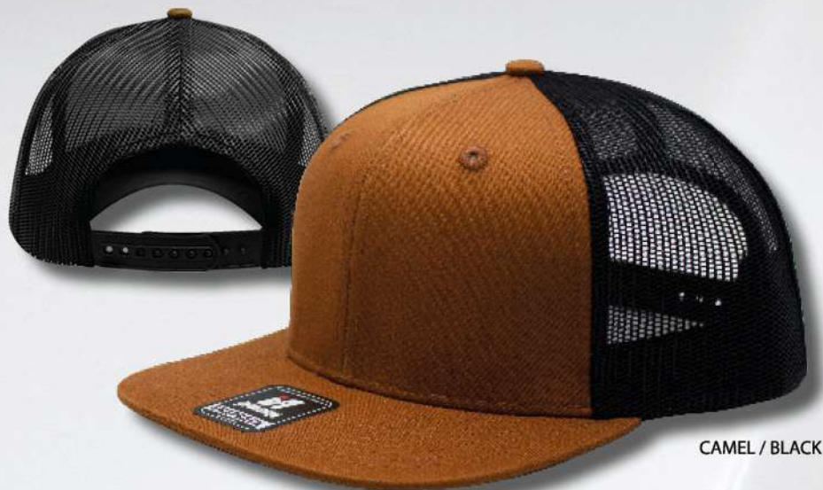
CAMEL / BLACK