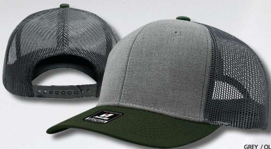
GREY / OLIVE