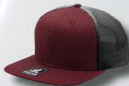
WINE / OXFORD