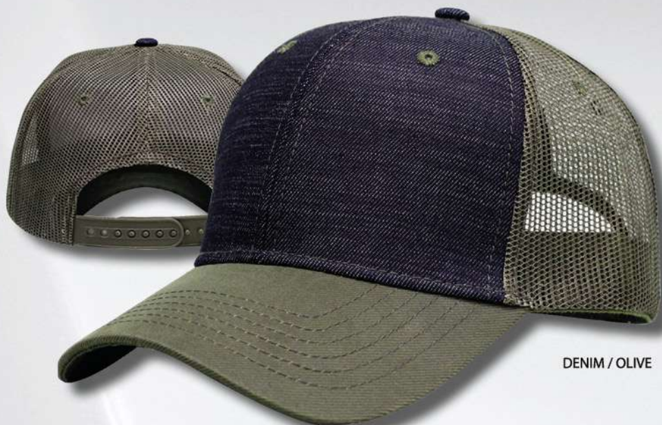
DENIM / OLIVE