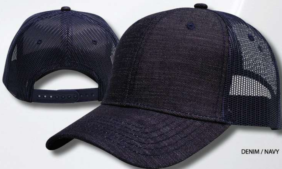
DENIM / NAVY