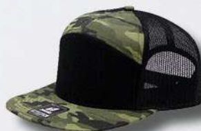
BLACK / CAMO / BLACK