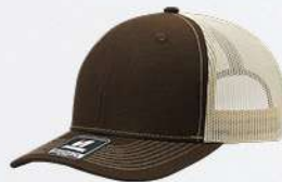
BROWN / STONE