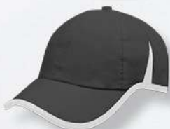
OXFORD / WHITE