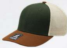
OLIVE / BROWN / STONE