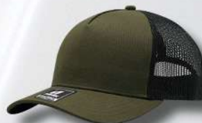
OLIVE / BLACK