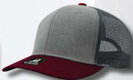
GREY / BURGUNDY