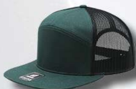
DK GREEN / BLACK