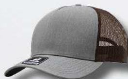
HEATHER GREY / BROWN