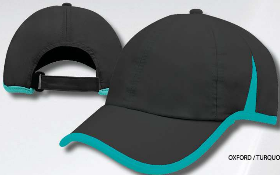
OXFORD / TURQUOISE