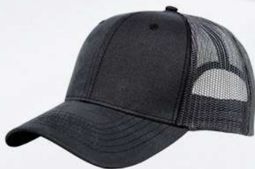
GREY / OXFORD