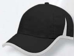
BLACK / WHITE