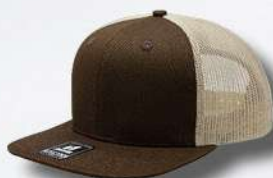
BROWN / KHAKE