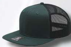
DK GREEN / BLACK