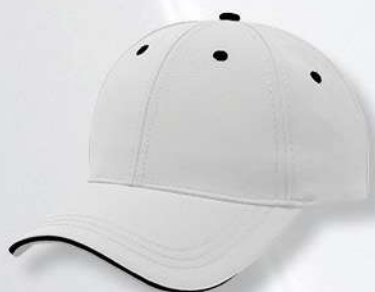
WHITE / BLACK