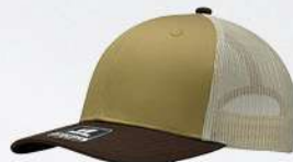
CORN / BROWN / STONE