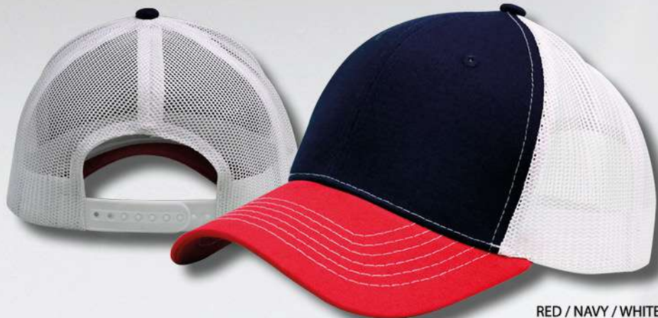
RED / NAVY / WHITE