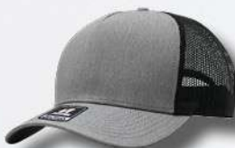
HEATHER GREY / BLACK