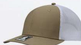
KHAKI / WHITE