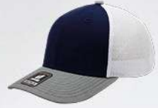
NAVY / HEATHER GREY / WHITE