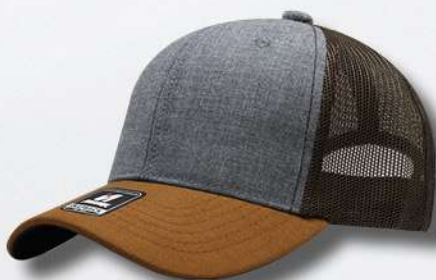
HEANTHER GREY CAMEL BROWN