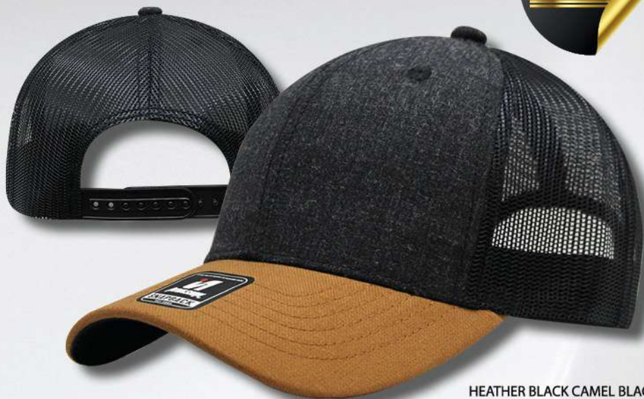
HEATHER BLACK CAMEL BLACK