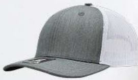
HEATHER GREY / WHITE