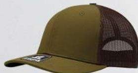
MOSS / BROWN