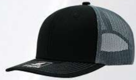
BLACK / OXFORD