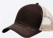
BROWN / KHAKI