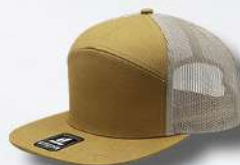
MUSTARGE / BEIGE