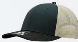
GREEN DK / BROWN / STONE