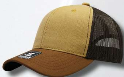
MUSTARGE CAMEL BROWN