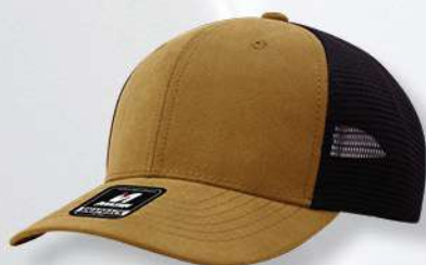
CAMEL / BLACK