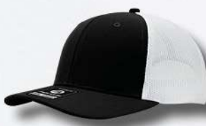
BLACK / WHITE