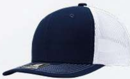
NAVY / WHITE