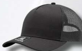
CHARCOAL / OXFORD