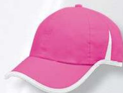
NEON PINK / WHITE