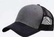
BLACK / OXFORD / BLACK