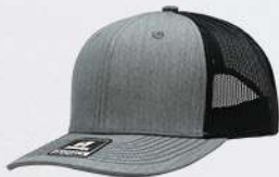
HEATHER GREY / BLACK