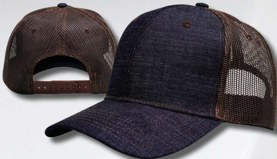
DENIM / BROWN