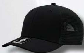
BLACK / BLACK