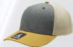
HEATHER GREY / MUSTARD / STONE