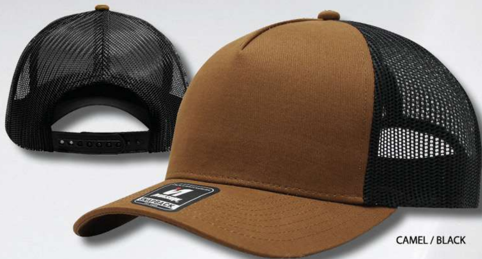
CAMEL / BLACK