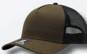
BROWN / BLACK