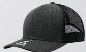
HEATHER BLACK / BLACK