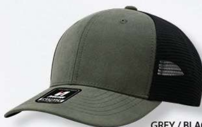
GREY / BLACK