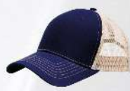
NAVY / KHAKI