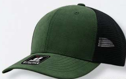
OLIVE / BLACK