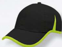
BLACK / NEON GREEN