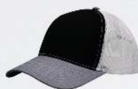
BLACK / HEATHER GREY / WHITE