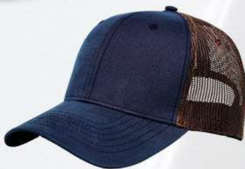
NAVY / LT BROWN