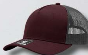
WINE / OXFORD