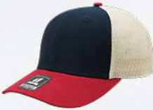
NAVY / WINE / STONE