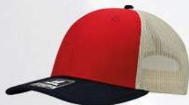
RED / BLACK / STONE