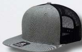
HEATHER GREY / BLACK